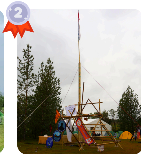
Ægissbúar eiga næst hæstu fánastöngina sem nær 13,93 metra hæð! Ægissbúar have the second tallest flagpole which is 13.93 meters high!