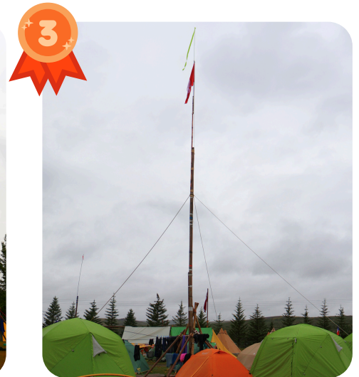
Kanadískir skátar ná þriðja sæti með 12,9 metra háa fánastöng! Canadian scouts make third place with their 12.9 meter high flagpole!